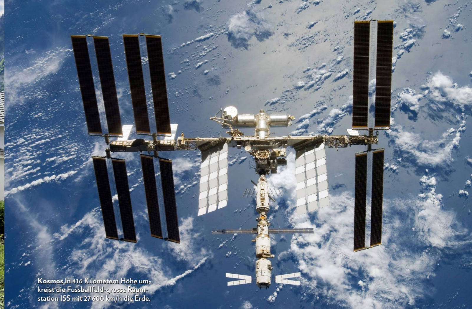
Kosmos In 416 Kilometern Höhe umkreist die Fussballfeld-grosse Raumstation ISS mit 27 600 km/h die Erde.