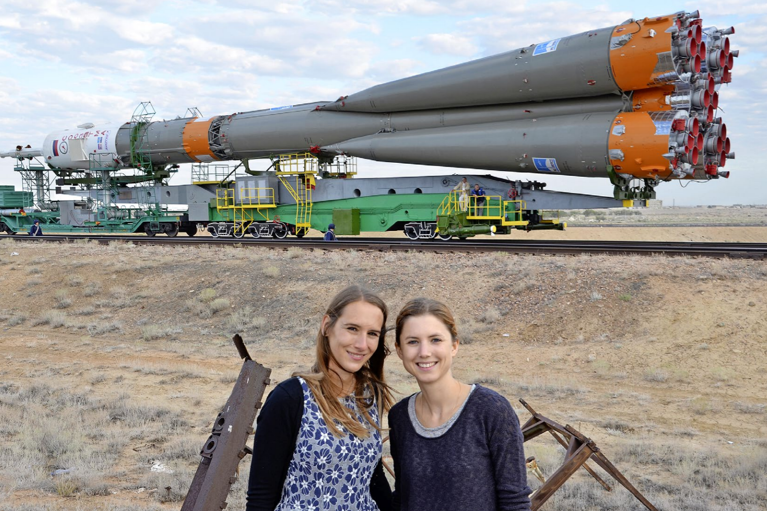
Feuerkraft 2. September 2015. Die Sojus-Rakete startet im russischen Baikonur. An Bord: das Experiment aus der Schweiz.