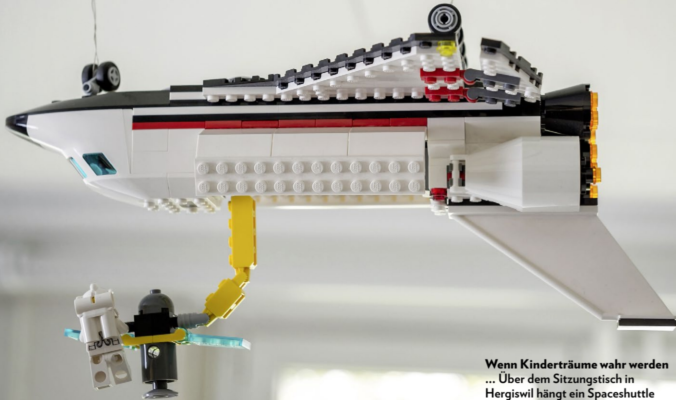
Wenn Kinderträume wahr werden ... Über dem Sitzungstisch in Hergiswil hängt ein Spaceshuttle aus Lego.