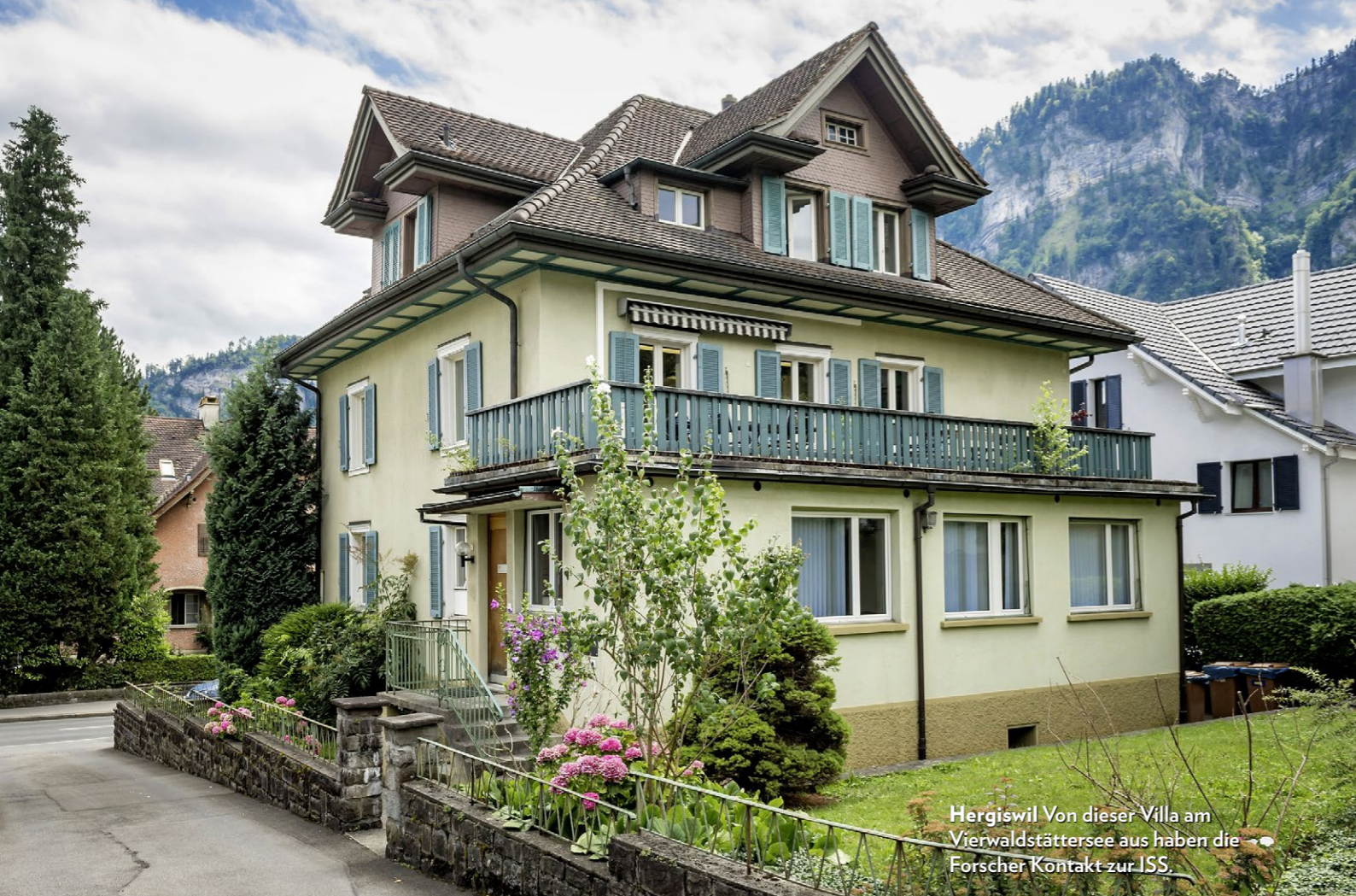
Hergiswil Von dieser Villa am Vierwaldstättersee aus haben die Forscher Kontakt zur ISS.