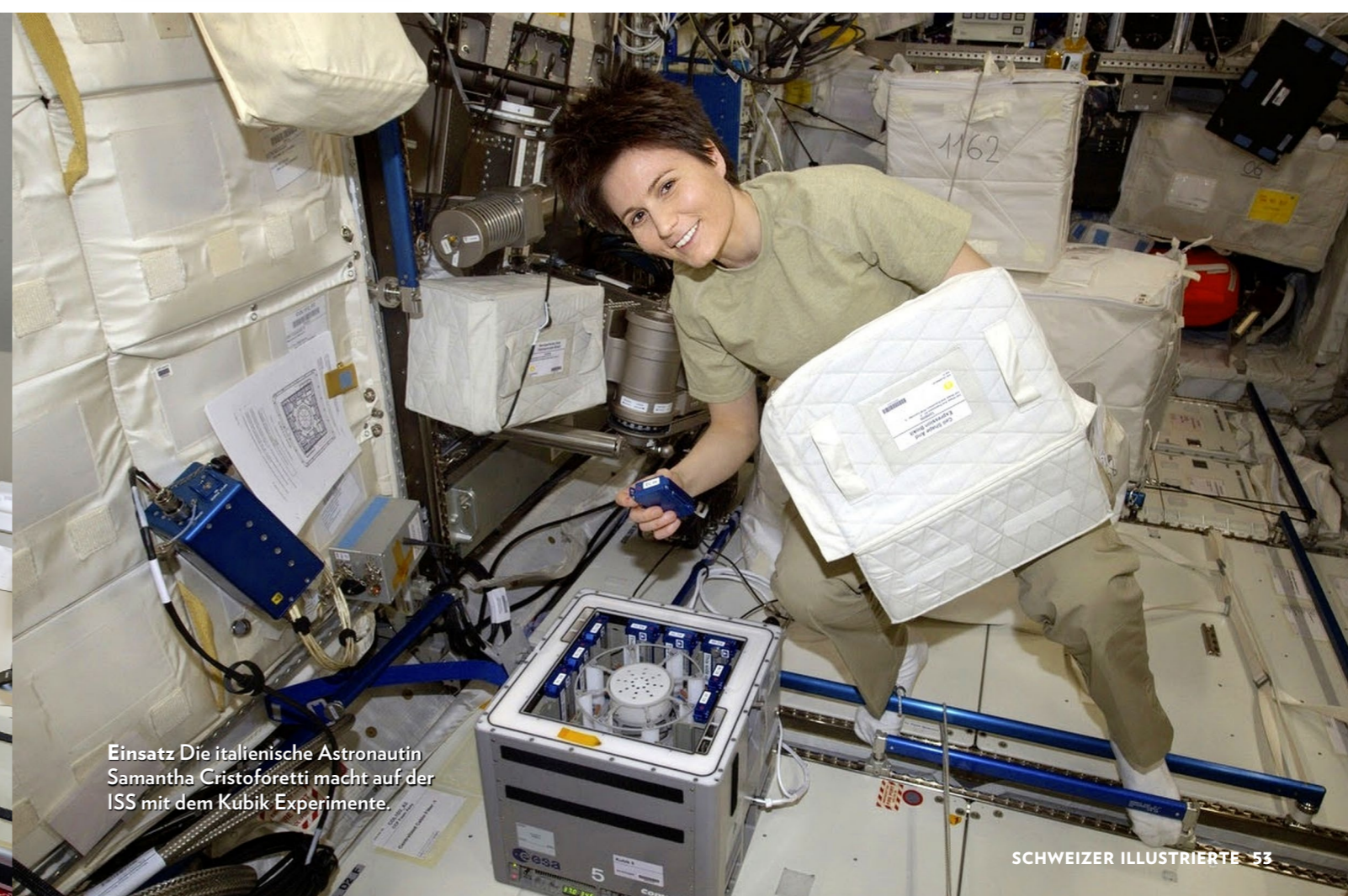
Einsatz Die italienische Astronautin Samantha Cristoforetti macht auf der ISS mit dem Kubik Experimente.