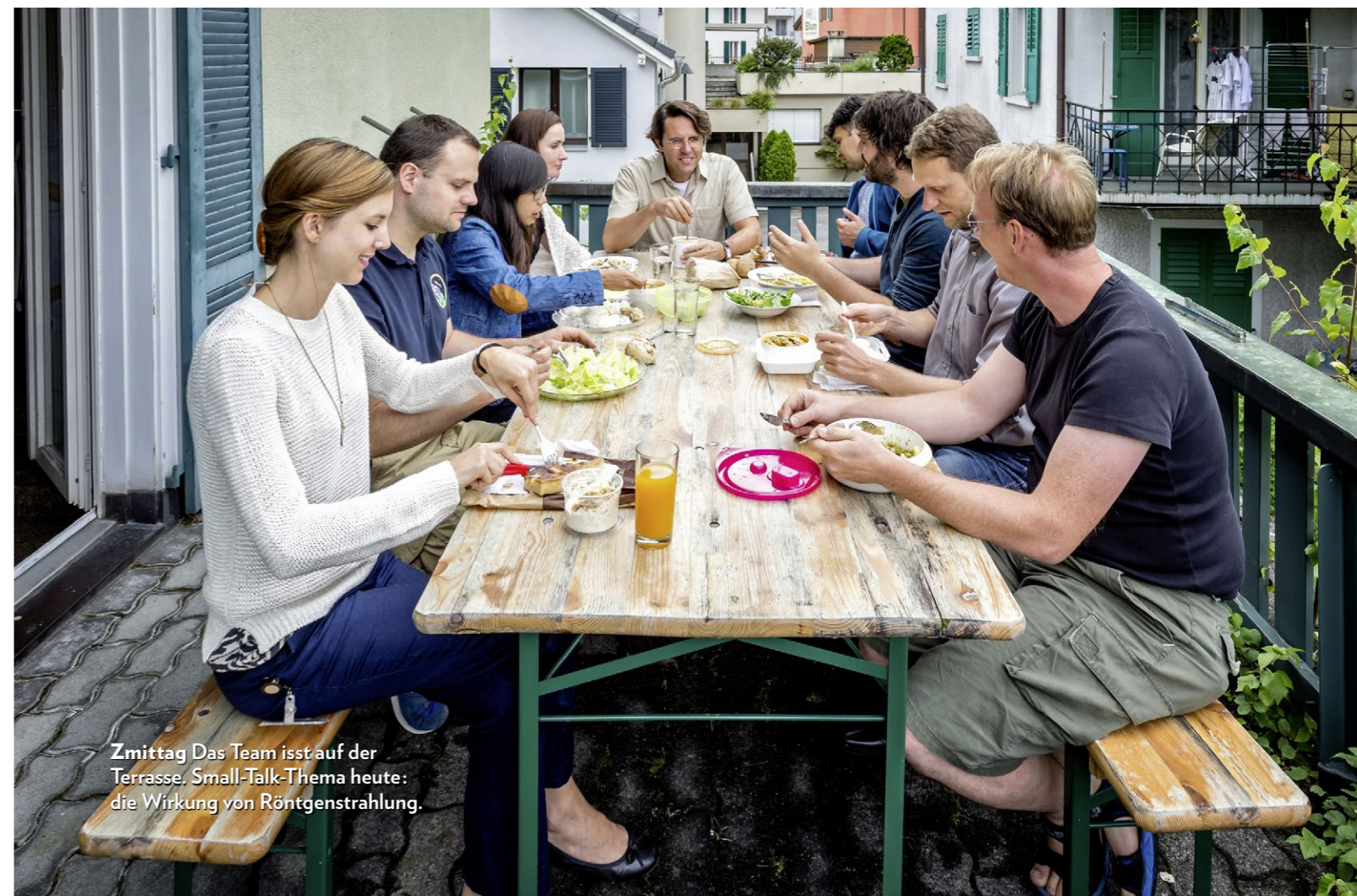
Zmittag Das Team isst auf der Terrasse. Small-Talk-Thema heute: die Wirkung von Röntgenstrahlung.