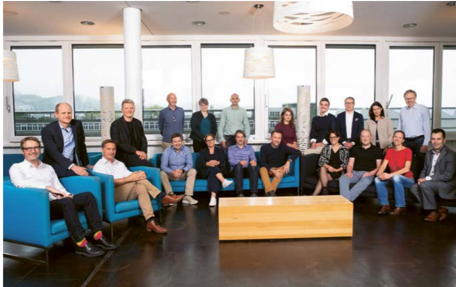
Team der Programmleitenden am IBR

Über 60 Weiterbildungsangebote bieten Ihnen Bildungschancen mit hohem Praxisnutzen. Als Teilnehmende gestalten Sie Ihre Weiterbildung aktiv mit und werden durch die jeweiligen Leitenden der Weiterbildungsprogramme und die Dozierenden auf Augenhöhe gefordert und gefördert. So bringen wir Menschen, Organisationen und Regionen weiter – mit Begeisterung und Engagement. Nutzen auch Sie unsere Weiterbildungskompetenz.