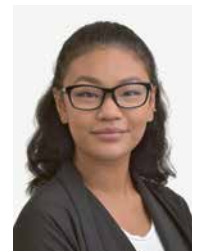
Nen Arreeya Rast Administration