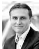
Philipp Ries google Schweiz, Industry Leader «Der digitale Kanal ist heute ein integraler Bestandteil jeglicher Phase des Reise- prozesses. Hier gibt es für uns in der Schweiz noch viele Möglichkeiten innovativ zu sein und Mehrwert zu bieten.»