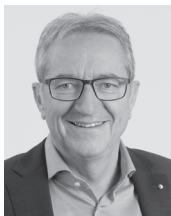
Robert Küng Regierungsrat des Kantons Luzern, Vorsteher des Bau-, Umwelt- und Wirtschafts- departements