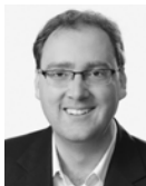
Raphael Prinz Schweizer Radio und Fernsehen SRF, TV-Inland-Korrespondent für die Zentralschweiz, Moderator