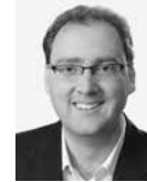
Raphael Prinz Schweizer Radio und Fernsehen SRF, TV-Inland-Korrespondent für die Zentralschweiz, Moderator