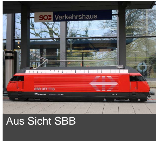
Aus Sicht SBB