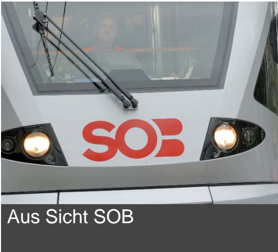
Aus Sicht SOB