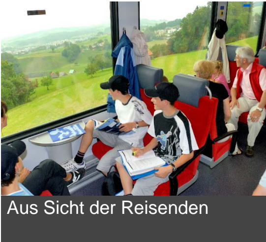
Aus Sicht der Reisenden