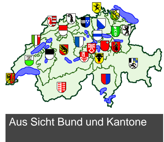
Aus Sicht Bund und Kantone