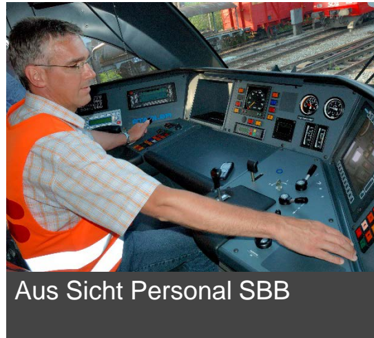
Aus Sicht Personal SBB