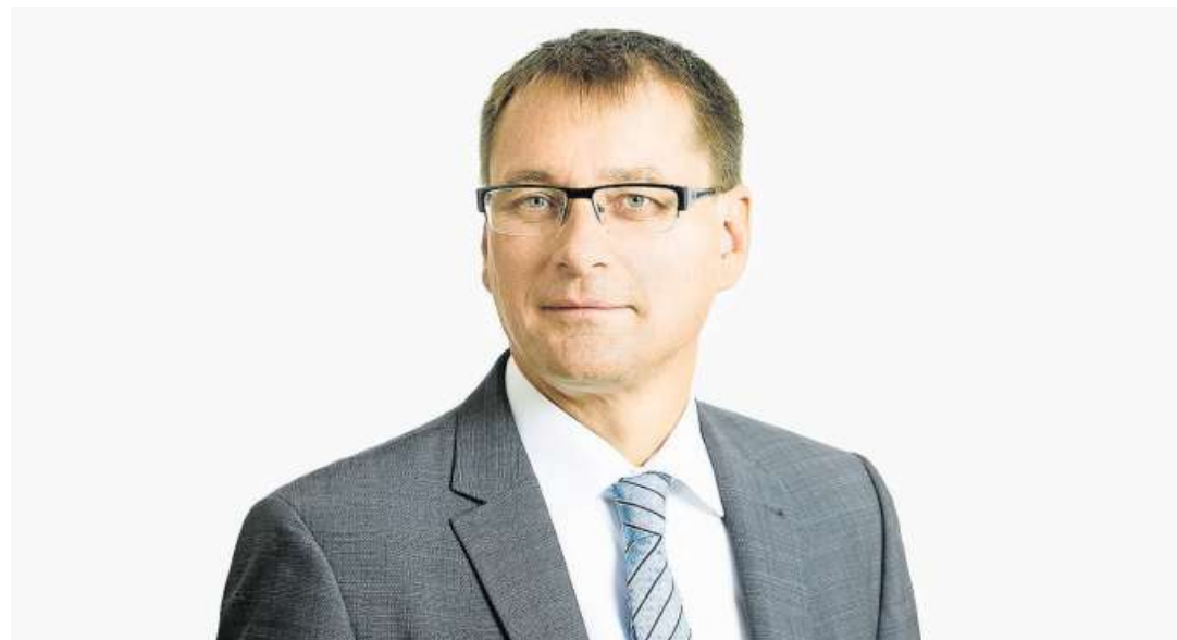
Ab Mai 2019 Valiant-CEO: Ewald Burgener.

Valiant Finanzchef Ewald Burgener wird CEO der Valiant-Bank. Sein Fokus richtet sich auf die Erschliessung neuer Ertragsfelder.