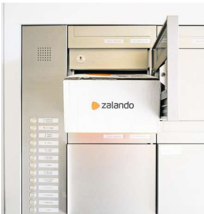
Grosse Pakete sind für Diebe leichte Beute.

Wie genau die grossen Onlinehändler sich schützen, will der Sprecher nicht sagen. Zu gross ist die Angst, Nachahmer