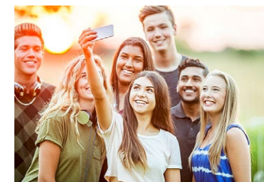
Menschliche Aspekte stehen bei Jugendlichen für die Berufswahl ganz oben.

Eine von der Schweizerischen Bankiervereinigung (SBVg) in Auftrag gegebene und von Gateway.one durchgeführte Umfrage bei über 1000 Jugendlichen zwischen 13 und 16 Jahren ergab Überraschendes: Abwechslung, Arbeit im Team, Weiterbildungsmöglichkeiten nach der Lehre, der Kontakt mit Menschen sowie die Betreuung der Lernenden sind für die Lehrstellenwahl weit wichtiger als die Verwendung moderner Technologien im Arbeitsalltag. Aus derselben Umfrage geht hervor, dass die Banklehre die mit Abstand beliebteste unter den kaufmännischen Berufsbildungen ist. Zum dritten Mal in Folge steht die Bankenbranche an der Spitze. Das Image des Bankberufs ist bei einer Mehrheit der befragten Jugendlichen gut bis sehr gut. Gemäss dem Ler-