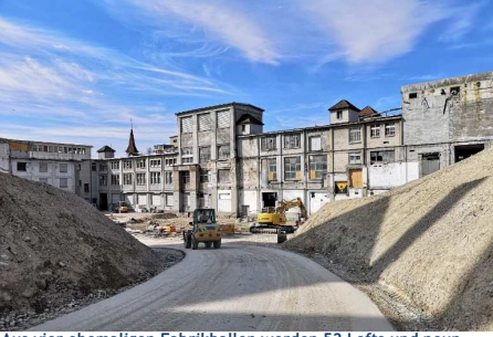
Aus vier ehemaligen Fabrikhallen werden 52 Lofts und neun Ateliers.