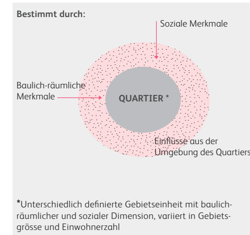
Abbildung 9: Schematische Darstellung der Einflussparameter für die Definition eines Quartiers