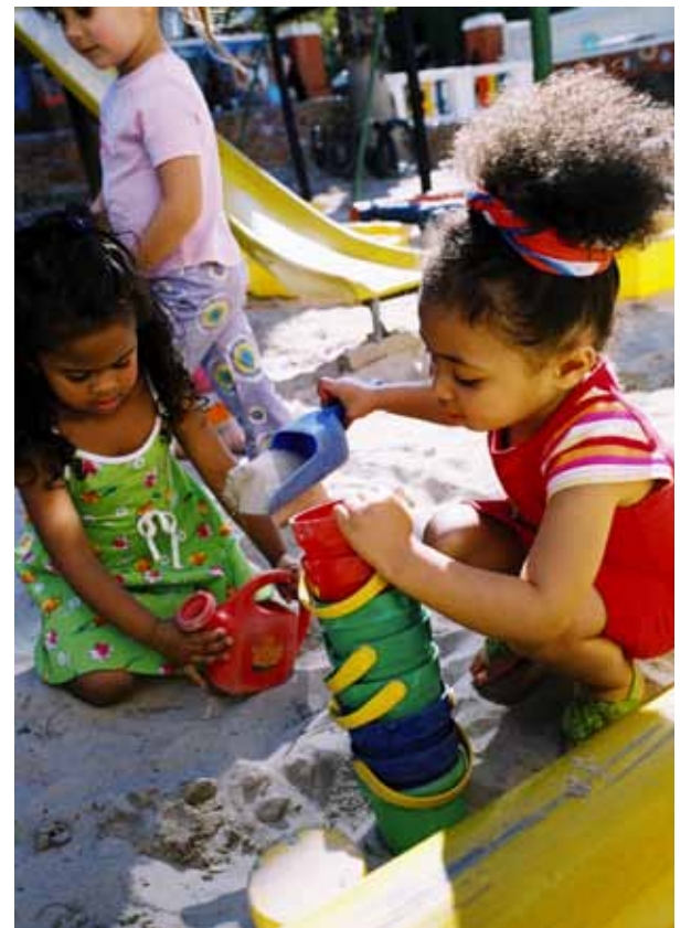
Luzerner Kinder profitieren von den erfolgreichen Massnahmen Früher Förderung (Symbolbild).