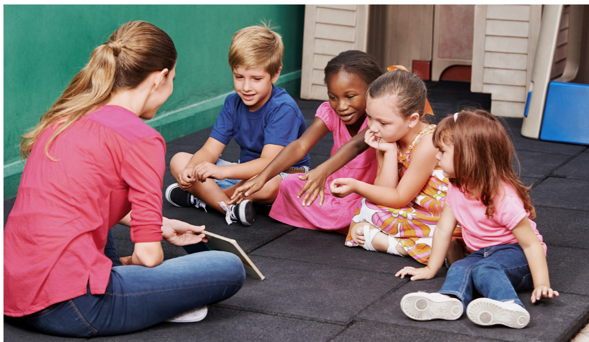
Kinder, die Deutsch als Zweitsprache lernen, haben vor Kindergartenbeginn einen erhöhten Sprachförderbedarf.

Die Luzerner Gemeinde Horw will vermehrt in die Sprachförderung von Kindern mit Migrationshintergrund und aus sozial benachteiligten Familien investieren. Bei der Ausarbeitung entsprechender Massnahmen waren sowohl Eltern, Fachpersonen als auch Mitglieder der Behörde und Politik beteiligt – mit dem Ziel, möglichst viele Interessen von Beginn weg zu berücksichtigen. Von Rebekka Ehret