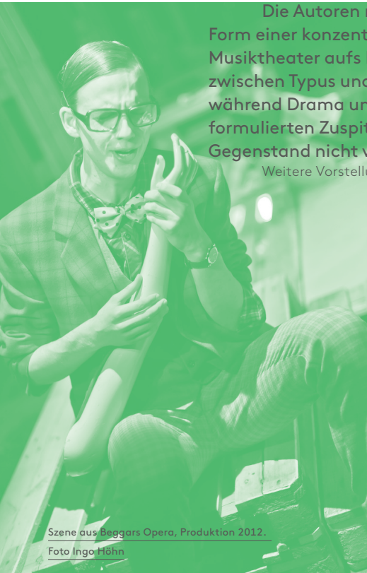
Szene aus Beggars Opera , Produktion 2012.

Weitere Vorstellungen: 15./16./24.05./05./06./07./12./14.06.2015