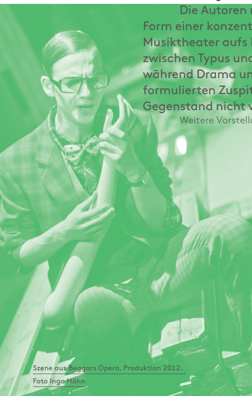
Szene aus Beggars Opera , Produktion 2012.

Weitere Vorstellungen: 15./16./24.05./05./06./07./12./14.06.2015