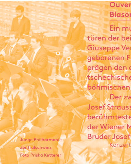
Junge Philharmonie Zentralschweiz

Konzertwiederholung: So 11.01.2015, 17.00 h, Zentrum SOSTA Leuk