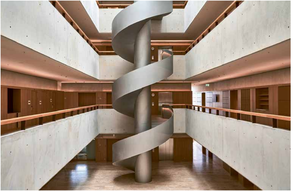
Wendeltreppe im Hauptgebäude