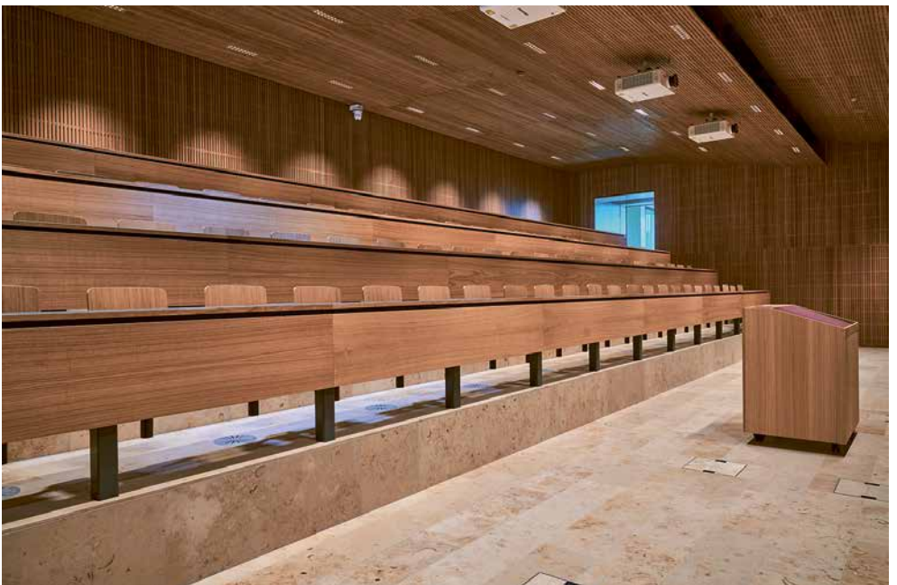
Auditorium, Audi Midi