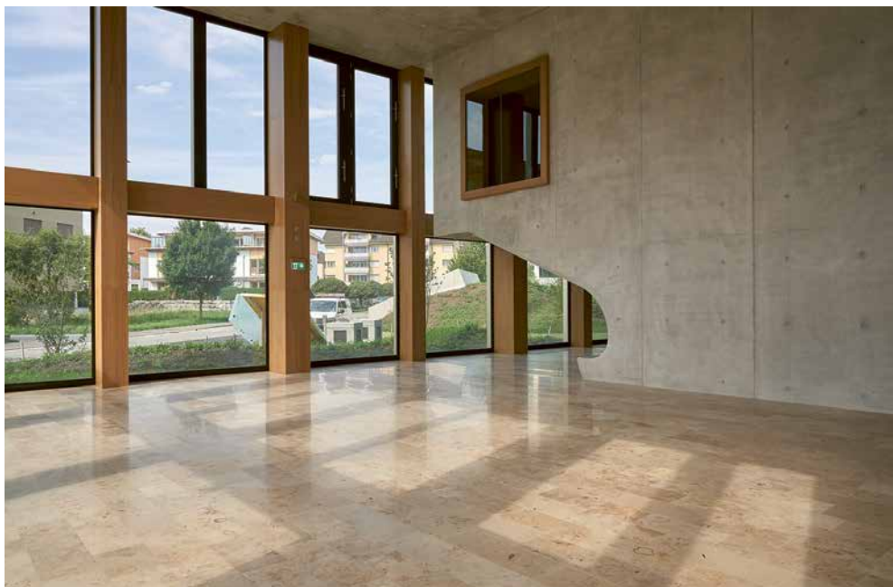
Aufenthaltszone und Wandelhalle