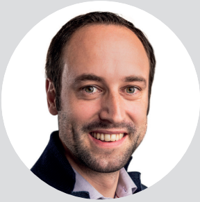
Christian Wasserfallen, Präsident FH SCHWEIZ, Nationalrat

«Diese Broschüre hebt die Wichtigkeit der Weiterbildung im Allgemeinen, auch on the Job, und im Speziellen, aus Sicht der Fachhochschul-Absolventen, des Arbeitsmarktes und der Fachhochschulen, hervor. Sie soll zudem aufklären und einen verständlichen Überblick schaffen.