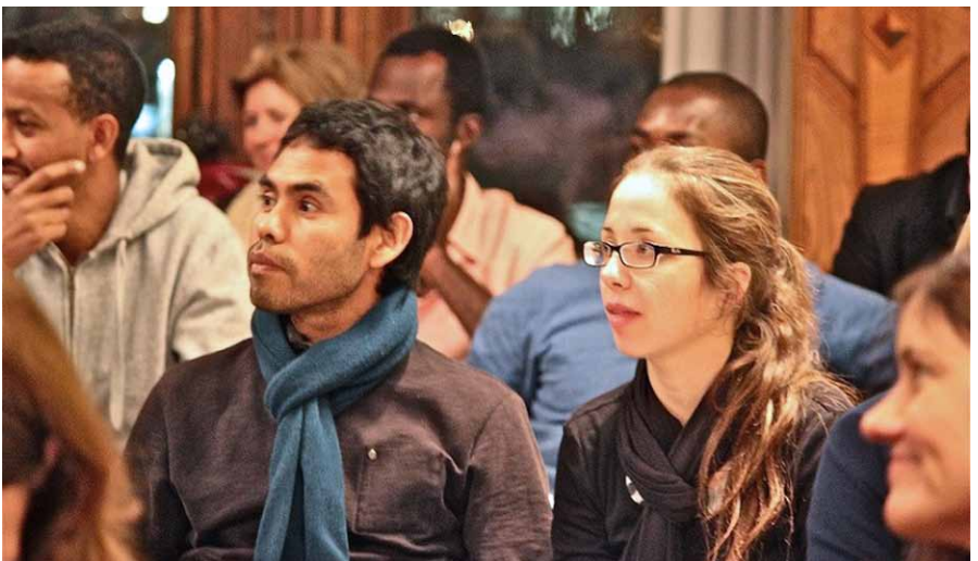
Begrüssung der Personen mit Niederlassungsbewilligung C.

Grundsätzlich will die Stadt Luzern mit ihrem Projekt Impulse setzen, um die Ressourcen und Potenziale von länger ansässigen Migrantinnen und Migranten zu nutzen und eigenverantwortliches Mitwirken anzuregen. Im Fokus stehen dabei die neu niedergelassenen Personen, die den C-Ausweis erhalten haben. Ziel dieses offiziellen Anlasses ist es, dass politisch und gesellschaftlich interessierte Migrantinnen und Migranten ihr Wissen um die Mitverantwortung und Teilhabe erweitern können und eine Möglichkeit zum Austausch erhalten.