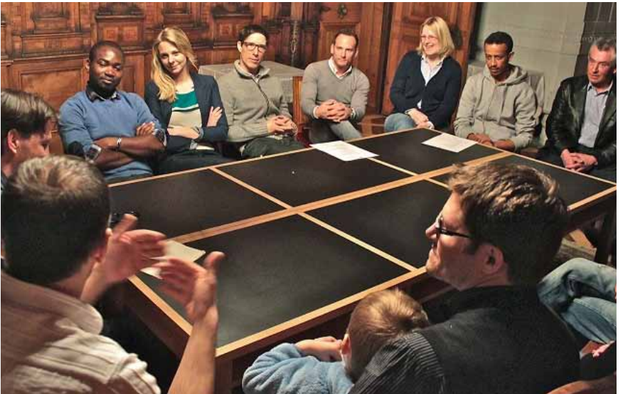
Austausch zu «Engagement im Sport»