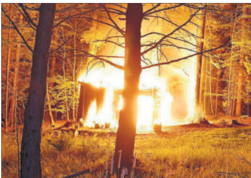
Die Ferienhütte im Gebiet Dorschnei/Krienseregg brannte vollständig nieder.

KRIENSEREGG Nur knapp entkamen drei Frauen am Montag einem Feuer. Und nur knapp führte dieses nicht zu einem Waldbrand.