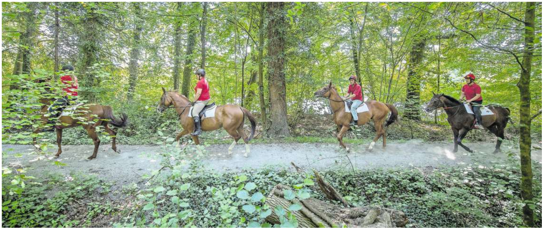
Reiter des Vereins Regionale Reitwege Rontal auf der Galopp-Piste im Schiltwald.

Reuss-Projekt Vor 40 Jahren wurde im Rontal ein schweizweit einzigartiges Reitwegnetz errichtet. Dieses dürfte nun aber teils dem Hochwasserschutzprojekt entlang der Reuss zum Opfer fallen.