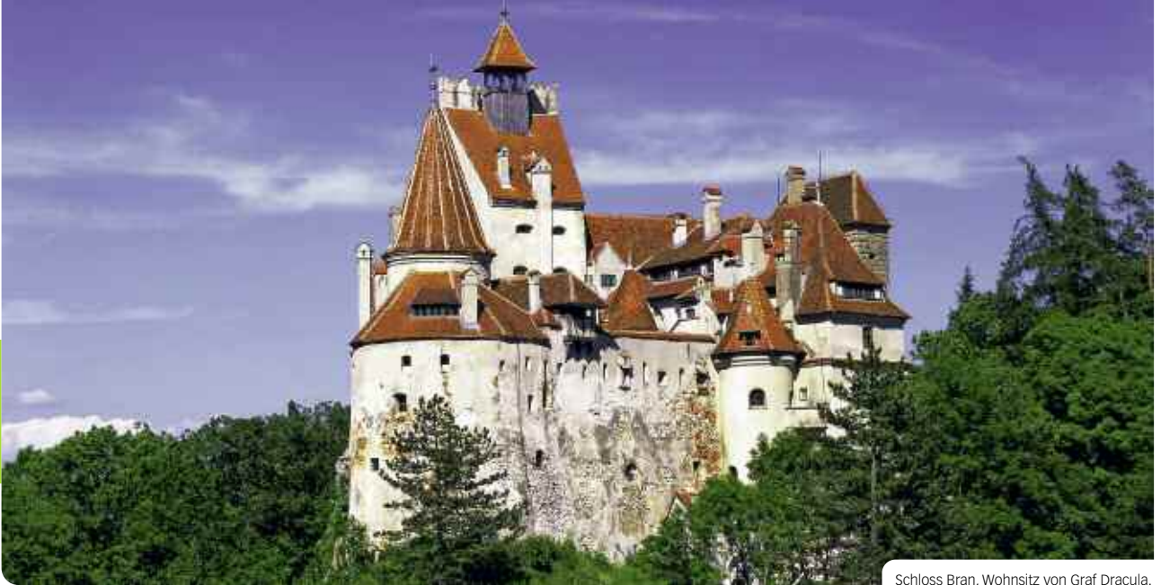
Schloss Bran, Wohnsitz von Graf Dracula.

Transsilvanien: Abenteuer im Wilden Osten Europas