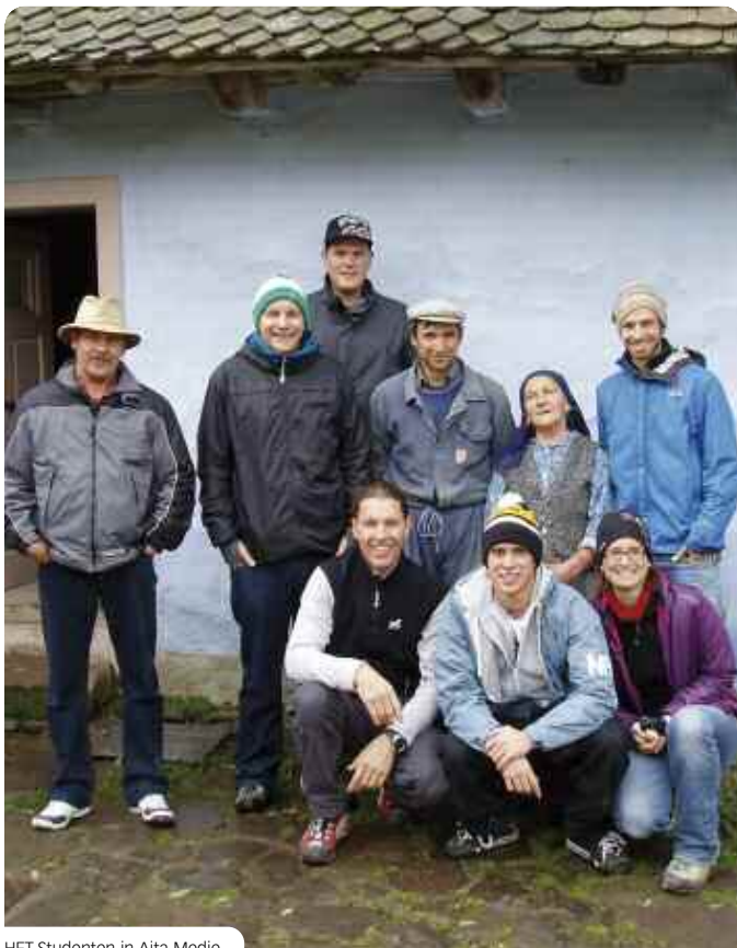
HFT-Studenten in Aita Medie.