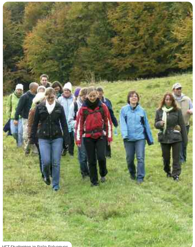
HFT-Studenten in Baile Balvanjos.