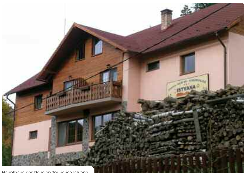
Haupthaus der Pension Touristica Istvana.