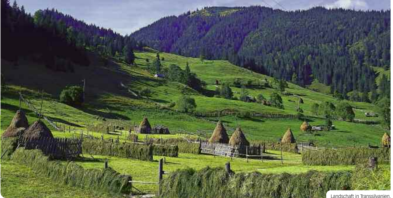
Landschaft in Transilvanien.