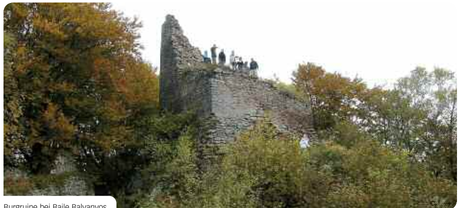
Burgruine bei Baile Balványos.