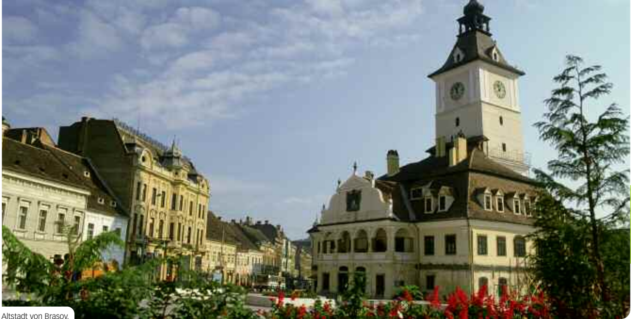
Altstadt von Brasov.