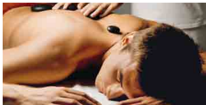
Gästegruppe der Zukunft: die Männer.

Das Institut für Tourismuswirtschaft ITW der Hochschule Luzern – Wirtschaft präsentiert die erste ausführliche Studie zum Schweizer Wellnessmarkt: «Bedeutung und Entwicklungsperspektiven des Gesundheits- und Wellnesstourismus in der Schweiz». Entspannung und Genuss rangieren im Wellness-Urlaub immer noch klar vor aktiver Erholung. Zu den wichtigsten Gästegruppen gehören Frauen, Männer sind die Kunden von morgen. www.hslu.ch/interact