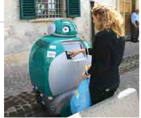
Teletubby-Design: der mobile Abfallcontainer DustCart.